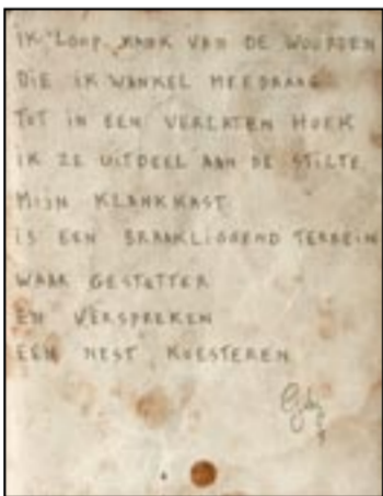
Gino De Rocker

Gino De Rocker zal op vrijdag langs het parcours gedichten voordragen. ( www.labobogaert.be/gino )